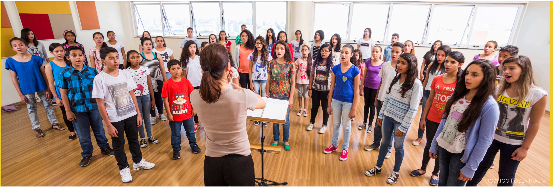
RODRIGO ROSENTHAL ©