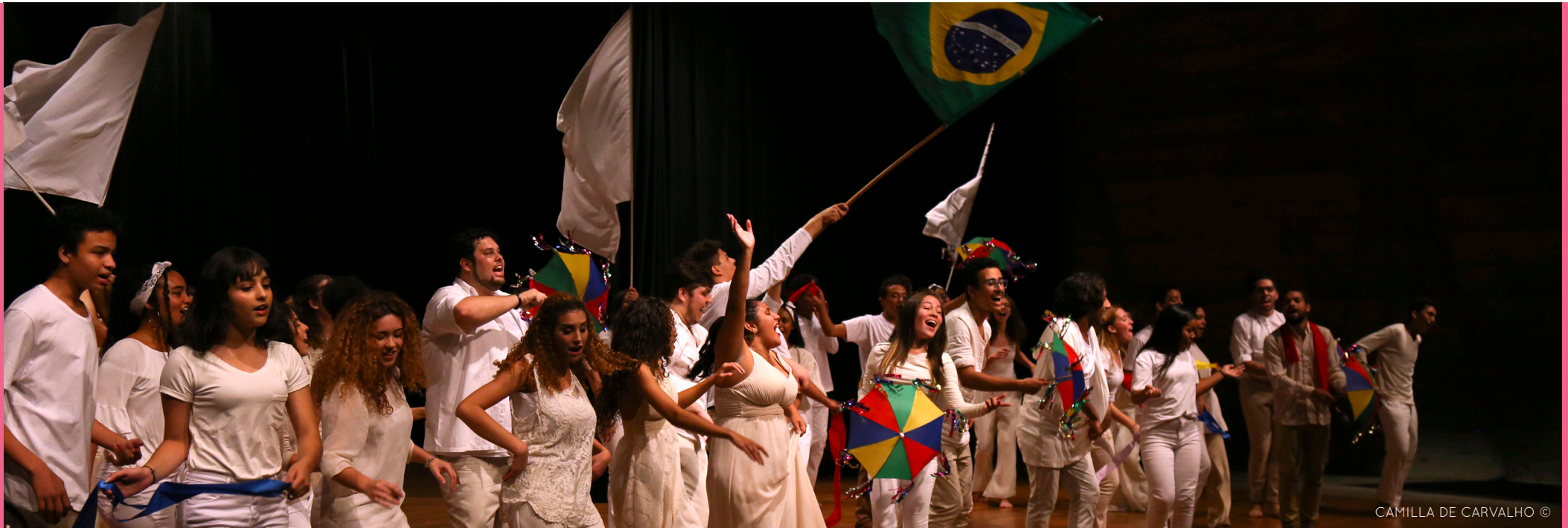
CAMILLA DE CARVALHO ©