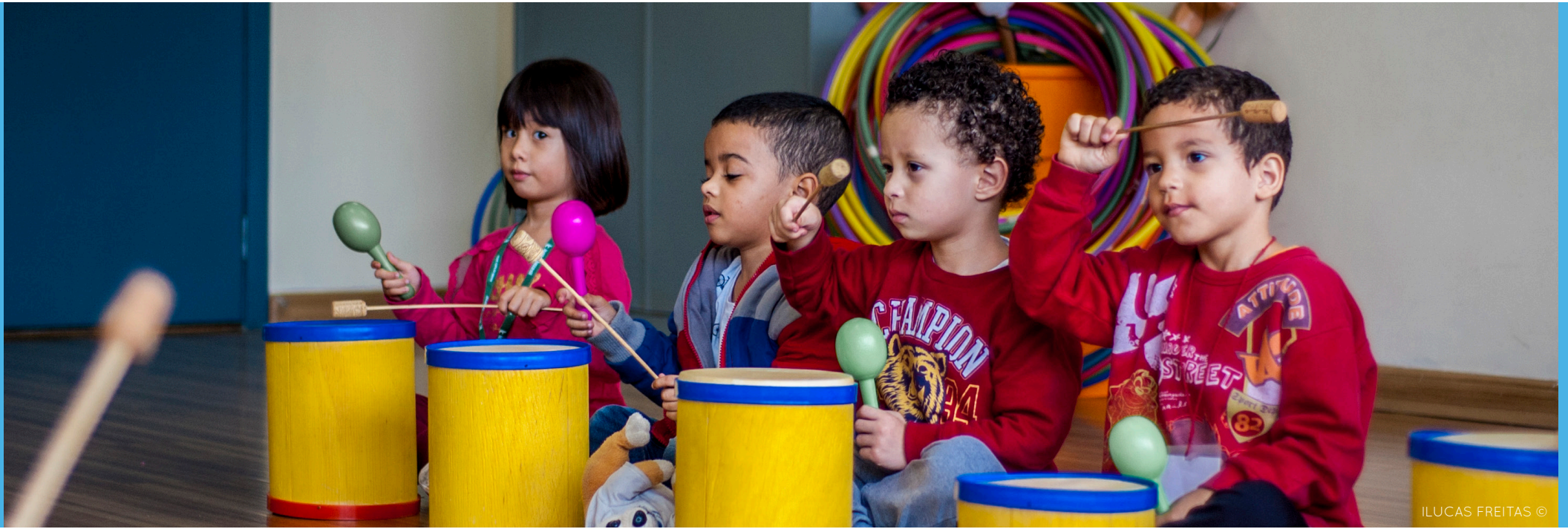
ILUCAS FREITAS ©