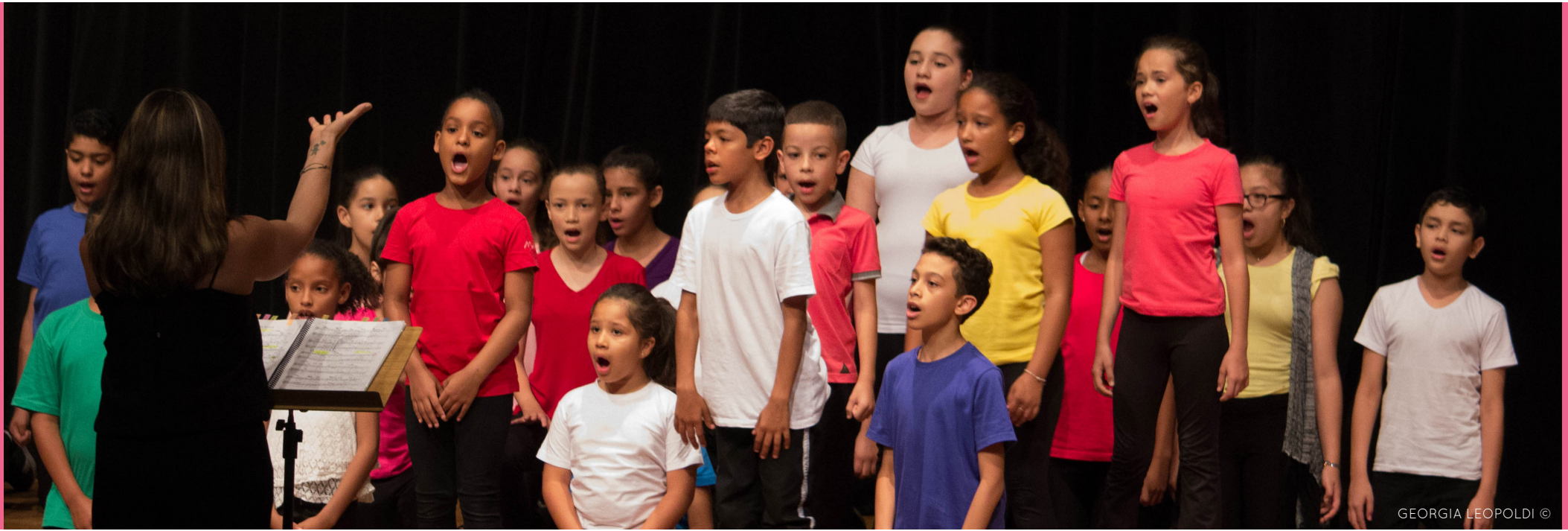
GEORGIA LEOPOLDI ©