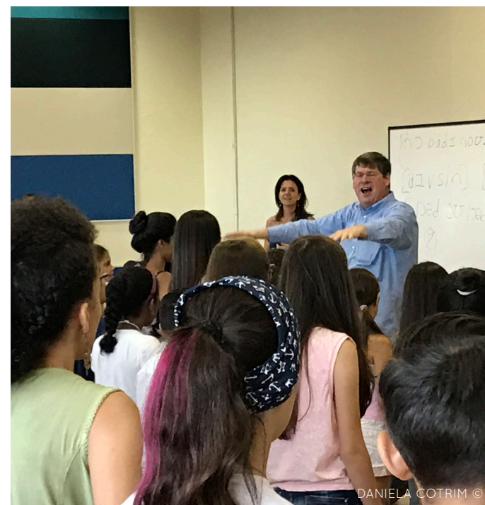
DANIELA COTRIM ©