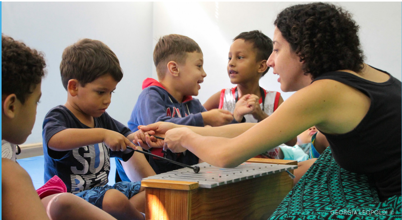
GEORGIA LEOPOLDI ©