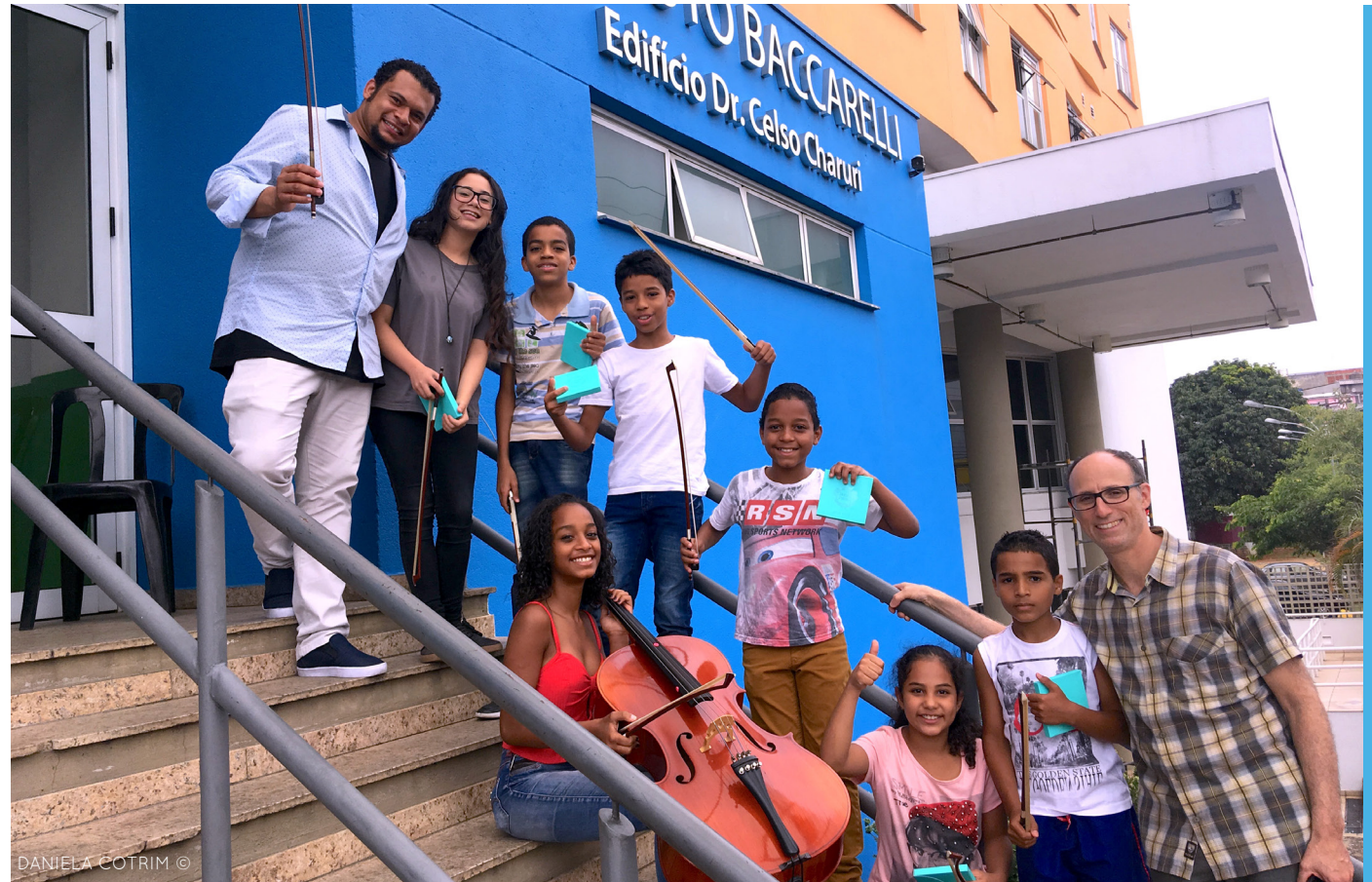
DANIELA COTRIM ©