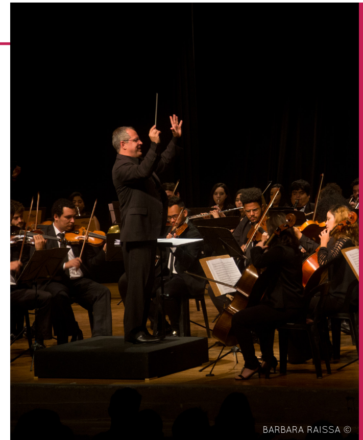
BARBARA RAISSA ©

As apresentações aos domingos permitem com que a temporada de eventos esteja inserida em um importante espaço de circulação da cidade de São Paulo, quando a Avenida Paulista está fechada para que todos possam aproveitar momentos de lazer. Com o intuito de se inserir nessa dinâmica paulistana , o Instituto Baccarelli promove intervenções musicais na rua , onde os próprios alunos convidam todos para assistirem ao concerto que acontecerá em breve no auditório do Museu. Com horários de início às 11h e às 16h, houve 20 shows em 2018, atingindo um público de aproximadamente 3 mil pessoas.