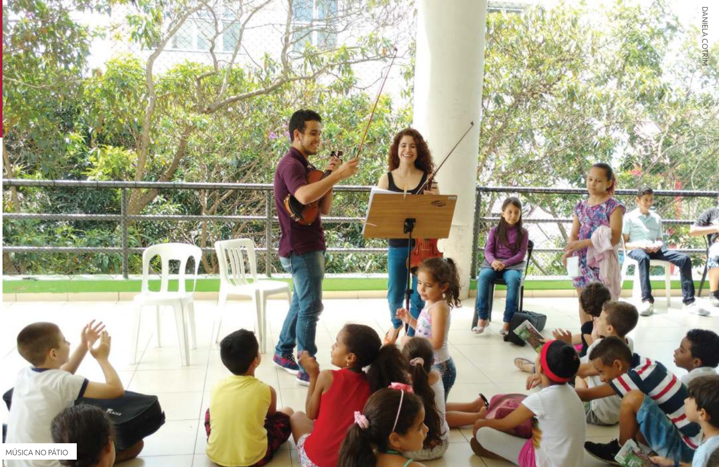
MÚSICA NO PÁTIO

Tão importante quanto promover as temporadas fixas em palcos tradicionais da cidade, como a Sala São Paulo e o MASP, é realizar no Instituto Baccarelli uma programação mensal de atividades com os alunos, gratuitas e abertas ao público interessado. Para tais práticas, os músicos se organizam, planejam, estudam por conta própria e se apresentam – em grupos de câmara ou como solistas – nas séries Noite Musical e Música no Pátio . Outras atividades gratuitas, que também possibilitam a participação de familiares, funcionários e amigos dos jovens estudantes, são as Aulas Abertas e Festivais promovidos regularmente pelo Instituto Baccarelli. O engajamento dos pais é determinante no aprendizado de seus filhos, já que eles são fundamentais para incentivá-los a frequentarem as aulas e também a praticarem em casa. Por esse motivo, o Instituto se empenha em aproximar esse novo universo da música clássica da família do aluno, motivando os pais a serem cada vez mais presentes em suas rotinas e atividades musicais.