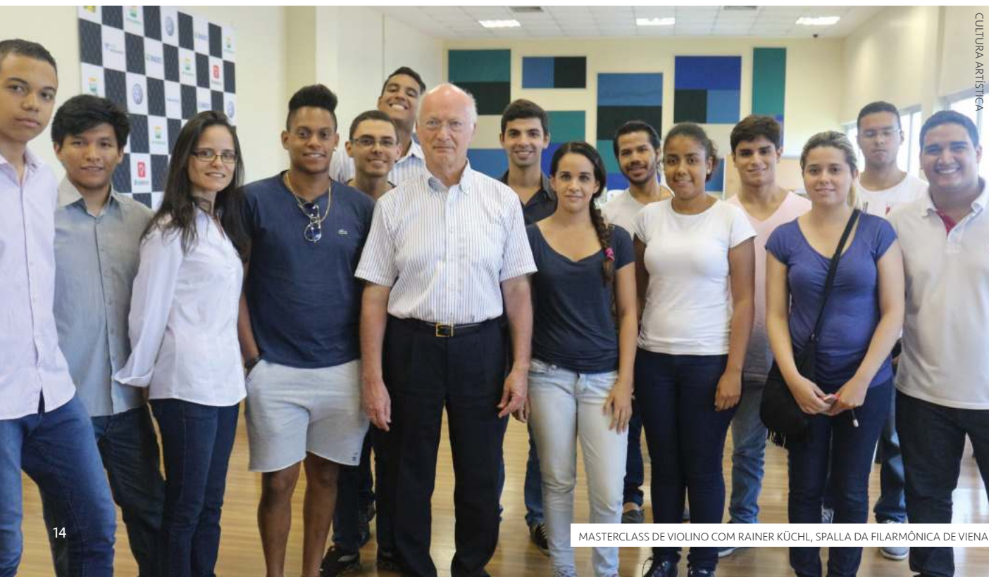
MASTERCLASS DE VIOLINO COM RAINER KÜCHL, SPALLA DA FILARMÔNICA DE VIENA