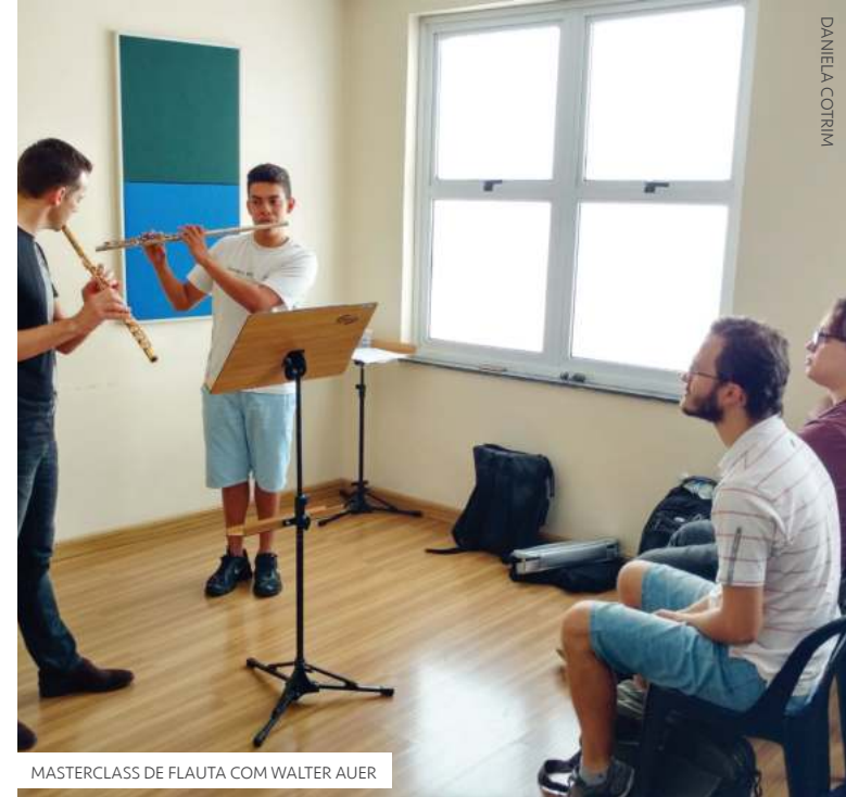
MASTERCLASS DE FLAUTA COM WALTER AUER