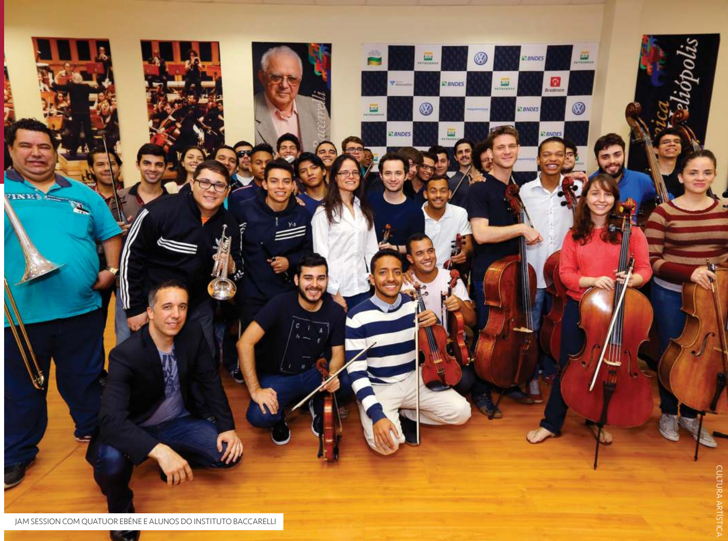
JAM SESSION COM QUATUOR EBÈNE E ALUNOS DO INSTITUTO BACCARELLI

No dia 18 de maio, recebemos no Instituto uma jam session com Quatuor Ebène. Formado por Pierre Colombet (violino), Gabriel Le Magadure (violin), Adrien Boisseau (viola) e Raphaël Merlin (violoncelo), o Quarteto começou a atividade com uma apresentação própria e convidou, em seguida, os alunos a participarem improvisando, de maneira informal, colaborativa, criativa, uma música em conjunto. O disco 'Brazil', lançado em 2014 pelos franceses, orientou a jam , que utilizou os arranjos da gravação, marcada pela bossa-nova, como guia para a atividade. Essa jam session foi uma realização da Cultura Artística em parceria com o Instituto Baccarelli, e entre os participantes executantes estavam bolsistas apoiados pela Cultura Artística, alunos do Instituto Baccarelli, da Academia da Osesp e também da EMESP.